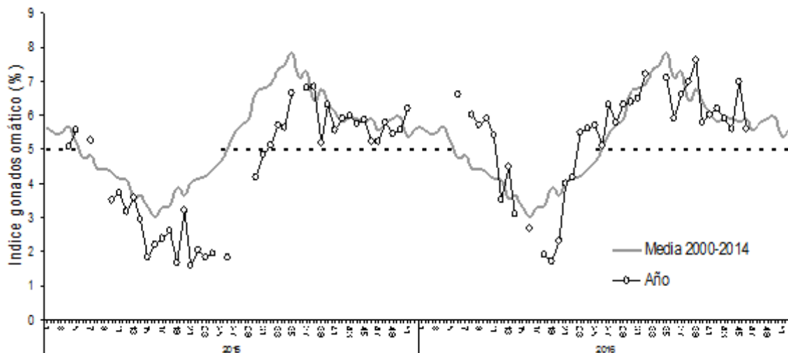
Figura 3 Evolución semanal del índice gonadosomático (IGS), años 2015 – 2016 y serie histórica 2000 – 2014. (La línea segmentada representa el valor IGS 5% referencial del evento reproductivo).

** Valor extraordinario días 22 y 23/9 levantada la veda = valor IAD = 46%; valor IAO = 0%; n = 6