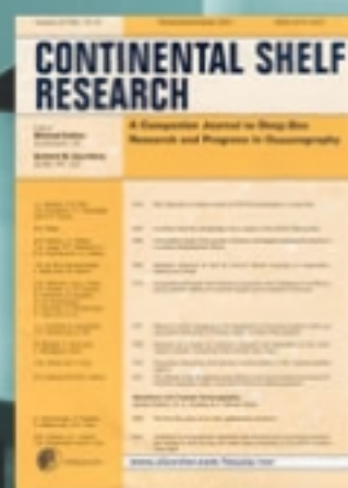
Continental Shelf Research