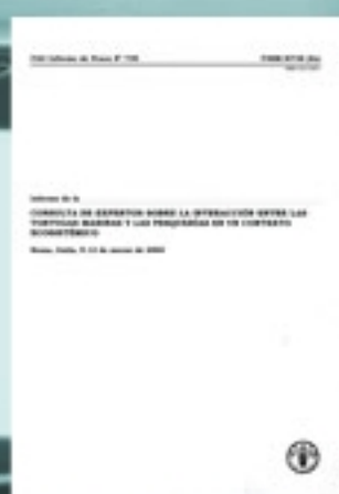
FAO: Consulta de expertos sobre la interacción entre las tortugas marinas...