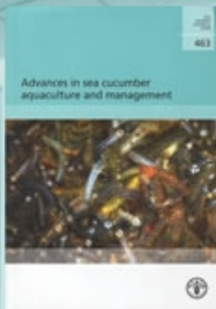
Advances in sea cucumber aquaculture and management