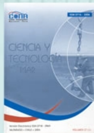
Ciencia y Tecnología CONA