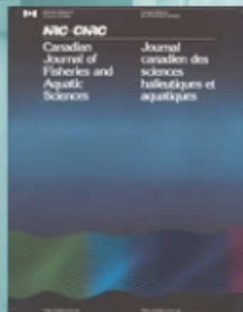
Canadian journal of fisheries and aquatic sciences