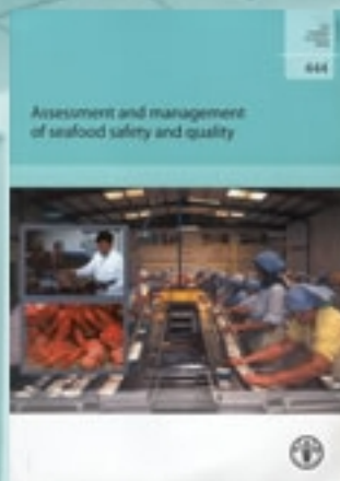
Assesment and management of seafood safety and quality

Indice de las últimas publicaciones ingresadas y que están disponibles en Biblioteca IFOP